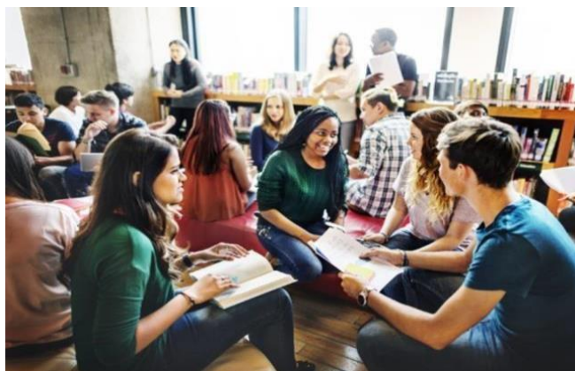
PDF : Éducation internationale

à continuer de redonner à notre secteur, et nous nous réjouissons de le voir croître. Nous espérons que ce document aidera les personnes qui viennent d'intégrer le secteur et leur fournira de l'information. Ce document sera évolutif et continuera à être bonifié chaque année. Si vous souhaitez y contribuer, vous pouvez vous impliquer dans les sous-comités du Réseau international des leaders de demain (RILD).