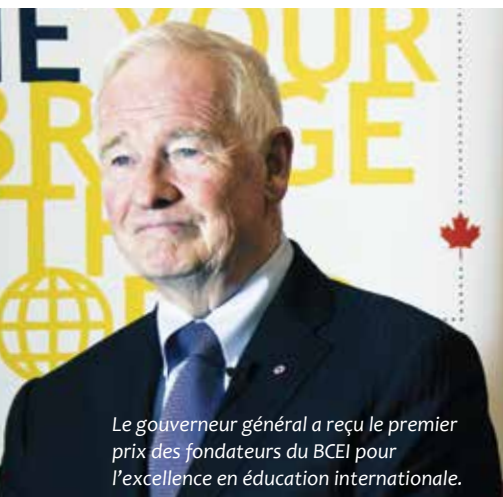
Le gouverneur général a reçu le premier prix des fondateurs du BCEI pour l'excellence en éducation internationale.