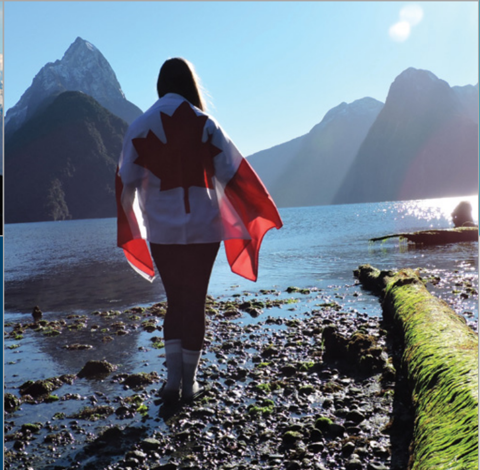
Photos : concours photos sur les études à l'étranger, 2017