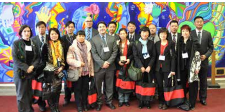
Une mission d'étude accueillie par le BCEI et son organisme sœur, la China Education Association for International Exchange (CEAIE); Northern Collegiate Institute and Vocational School à Sarnia, Ontario.

Le BCEI encourage les contacts entre le Canada et d'autres pays par la gestion de bourses au nom de gouvernements canadiens et étrangers. En 2012-2013, nous avons intégré la gestion de la composante la plus grande au Canada du programme de bourses Ciência sem Fronteiras (Science sans frontières). Ce programme de poids vise à donner une bourse internationale à plus de 100 000 étudiants d'ici à 2016, dont 12 000 devraient aller au Canada. Pendant notre première année du programme CsF, le BCEI a trouvé une place à 2 700 étudiants brésiliens de premier cycle dans des universités du Canada. Ces étudiants font des études de deux semestres et un stage pratique. À ce jour, le BCEI et ses partenaires ont arrangé 1 120 stages en entreprises et en recherche en établissement. Nous avons reçu un excellent soutien et une très bonne réaction des étudiants, établissements membres et autres intervenants sur ce programme. Les stages sont bénéfiques aux étudiants et aident aussi à tisser des liens entre les entreprises et industries canadiennes et brésiliennes.