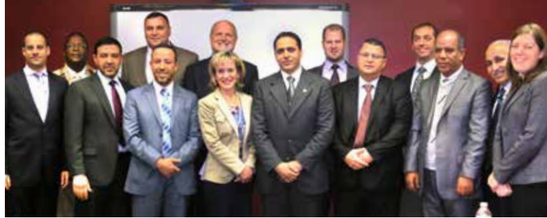
Visite au BCEI d'une délégation de Libye en janvier 2013.

Le BCEI a renforcé ses relations avec les dignitaires du gouvernement de Libye. Au nom du ministère libyen de l'Enseignement supérieur et de la Recherche, le BCEI gère plus de 2 500 bourses pour les étudiants libyens des cycles supérieurs, y compris des étudiants en médecine générale et dentaire, au Canada et aux États-Unis. Le BCEI gère aussi des programmes importants de bourses pour le gouvernement du Koweït et d'Arabie saoudite.